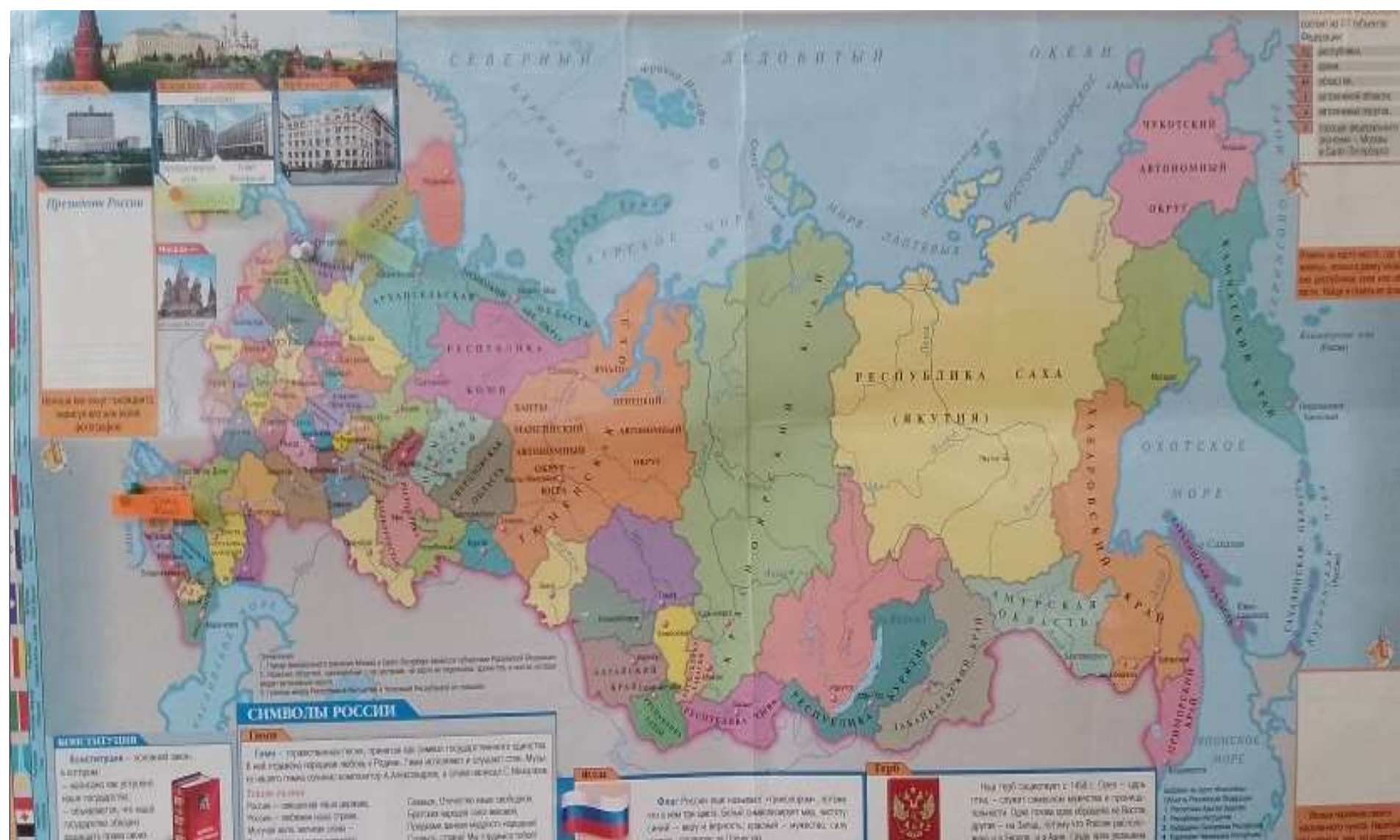
Изучили с детьми карту нашей страны, узнали, что Россия самая большая страна на континенте.