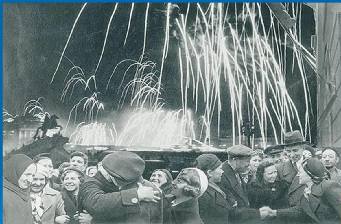
«ВЕЛИКАЯ ПОБЕДА ОДЕРЖАНА СОВЕТСКИМИ ВОЙСКАМИ ПОД ЛЕНИНГРАДОМ:

27 января 1944 года наши войска полностью освободили Ленинград от фашистской блокады. За город шли жестокие бои. За Родину солдаты воевали и в январе, разбив врага, кольцо блокадное прорвали.